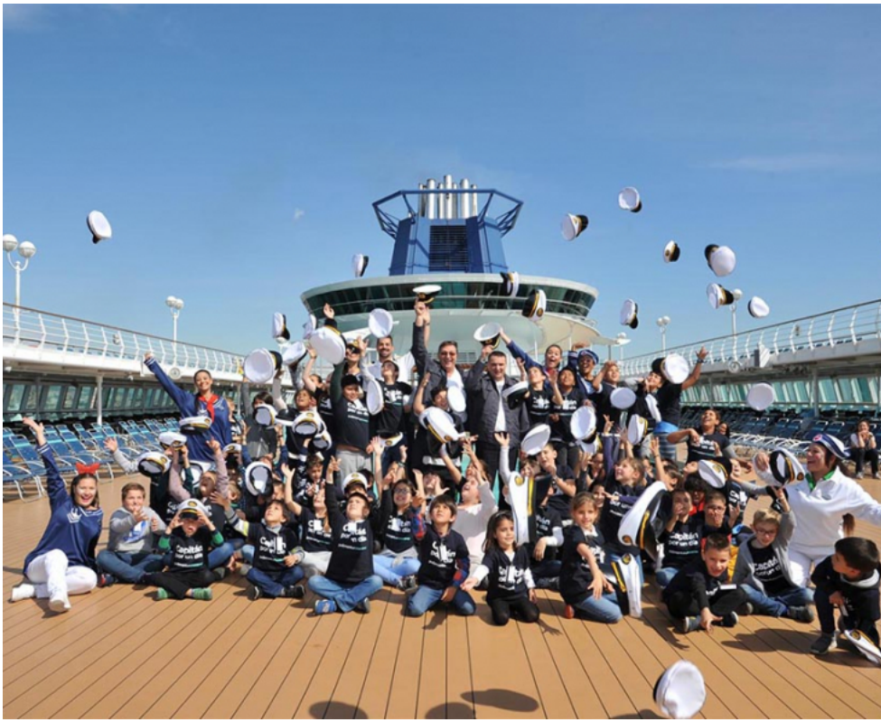
Cerca de 60 niños sienten como es ser capitán por un día de Pullmantur Cruceros