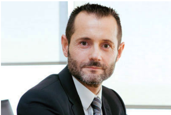
Un 85% del equipo de Gas Natural Fenosa está altamente comprometido