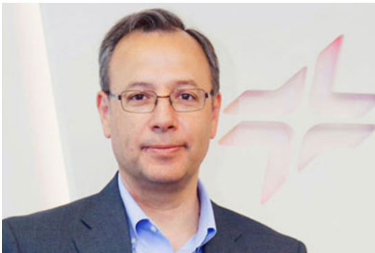
CEPSA: Nuestro talento está en nuestras personas y en el modo en que interactúan